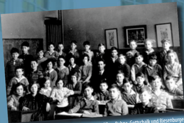
14. Gemeindeschule, Februar 1930. (heute: Löcknitzschule)