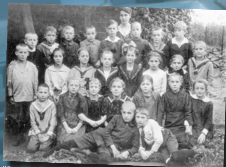
Höhere Knaben- u. Mädchenschule Lichtenrade um 1920. Aus dem Album Familie Freudenfels (heute: Ulrich-von-Hutten-Oberschule)