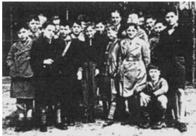
Zickel-Schüler bei einem Ausflug, 1938