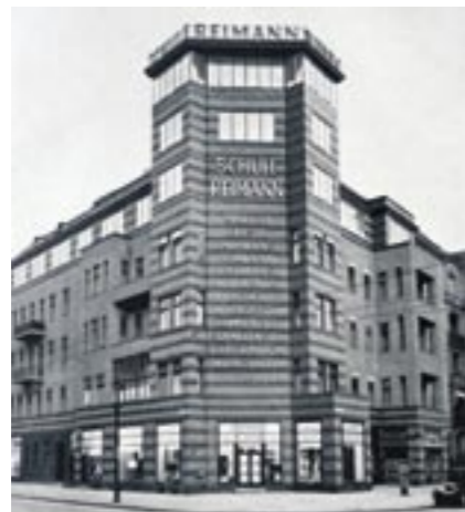
Die Reimann-Schule 1932 in der Landshtuter Straße 38, nach Umbau und Erweiterung durch zwei aufgesetzte Stockwerke

Hier, in diesem Raum, hat sich eine vielstimmige Erzählung eingeschrieben, entstanden in intensiver Zusammenarbeit mit Zeitzeuginnen und Zeitzeugen und ihren Nachkommen. Zu diesen gelebten Leben gehören aber auch die Erfahrungen von Ausgrenzung, Verfolgung, Entwürdigung und die Vertreibung und Ermordung von Familienangehörigen.