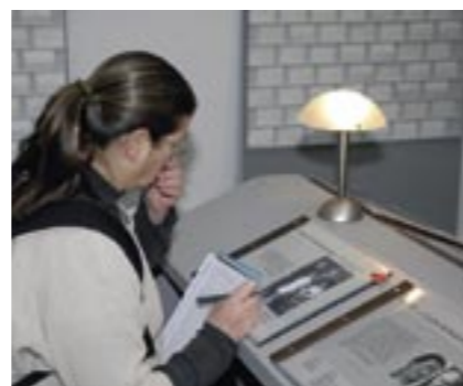
Besucherin in der Ausstellung