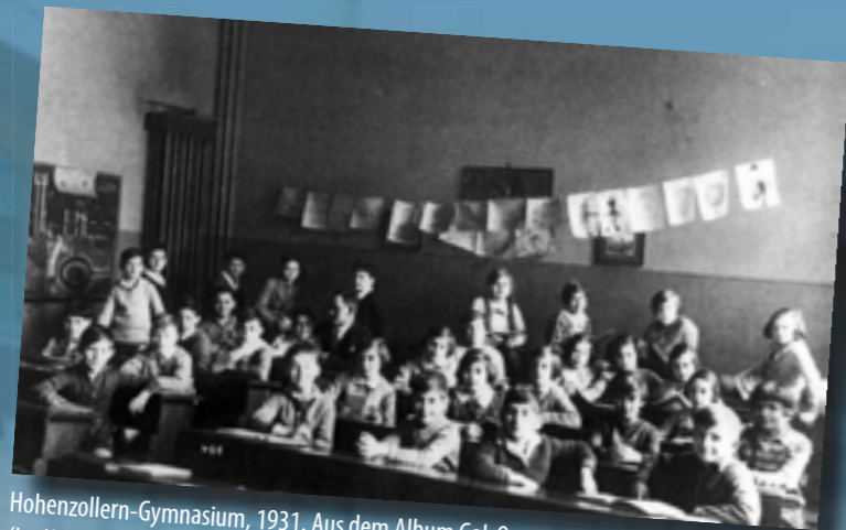
Hohenzollern-Gymnasium, 1931. Aus dem Album Gal-Or (im Krieg zerstört)