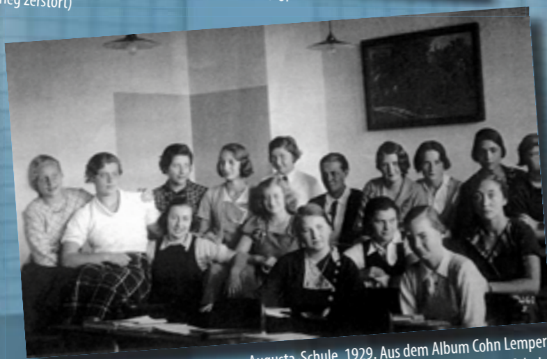
Augusta-Schule, 1929. (heute: Sophie-Scholl-Schule)