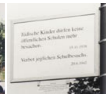
Vorder- und Rückseite einer Tafel aus dem 80-teiligen Denkmal der Künstler Stih/Schnock im Bayerischen Viertel.

Anmeldung und Information für den Besuch von Gruppen und Schulklassen (auch am Freitag) Kunstamt: (030) 90277-6964 Rollstuhlfahrer/-innen bitte anmelden hausamkleistpark-berlin@t-online.de www.hausamkleistpark-berlin.de Interview-Film, 44 Min. „Geteilte Erinnerungen“ von Monika Wenzel