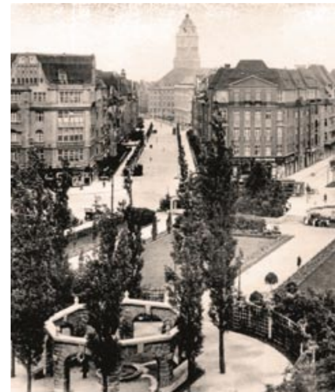
Der Bayerische Platz, das Zentrum des Bayerischen Viertels im Jahr 1939. Im Hintergrund der alte Turm des Schöneberger Rathauses, im Vordergrund das steinerne Oktogon.

The exhibition „Wir waren Nachbarn“ (We were neighbours) will open on occasion of the International Holocaust Remembrance Day at Schöneberg townhall on January 24th and will then be shown permanently. Daily opening hours are 10 am to 6 pm, closed on Fridays. Admission is free. The core of the exhibition is a collection of 131 family albums of former Jewish neighbours from the „Bayerisches Viertel“ (Bavarian quarter) and the entire district of Tempelhof-Schöneberg. Containing pictures, documents and reports these albums present an idea of life in Berlin before 1933 and the gradual steps of „isolation and deprivation of rights, expulsion, deportation and murder of Berlin Jews from 1933 to 1945“. This is also the name of the unique memorial by the artists Renata Stih and Frieder Schnock in the „Bayerische Viertel“, directly neighbouring Schöneberg townhall.