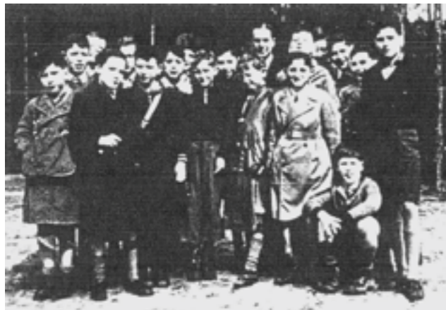
Zickel-Schüler bei einem Ausflug, 1938