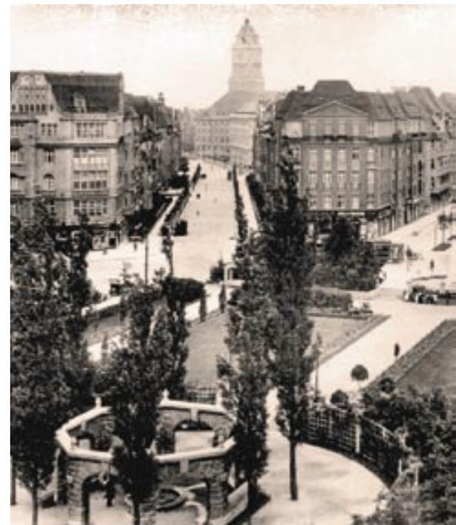
Der Bayerische Platz, das Zentrum des Bayerischen Viertels im Jahr 1939. Im Hintergrund der alte Turm des Schöneberger Rathauses, im Vordergrund das steinerne Oktogon.

The exhibition „Wir waren Nachbarn“ (We were neighbours) will open on occasion of the International Holocaust Remembrance Day at Schöneberg townhall on January 24th and will then be shown permanently. Daily opening hours are 10 am to 6 pm, closed on Fridays. Admission is free. The core of the exhibition is a collection of 131 family albums of former Jewish neighbours from the „Bayerisches Viertel“ (Bavarian quarter) and the entire district of Tempelhof-Schöneberg. Containing pictures, documents and reports these albums present an idea of life in Berlin before 1933 and the gradual steps of „isolation and deprivation of rights, expulsion, deportation and murder of Berlin Jews from 1933 to 1945“. This is also the name of the unique memorial by the artists Renata Stih and Frieder Schnock in the „Bayerische Viertel“, directly neighbouring Schöneberg townhall.